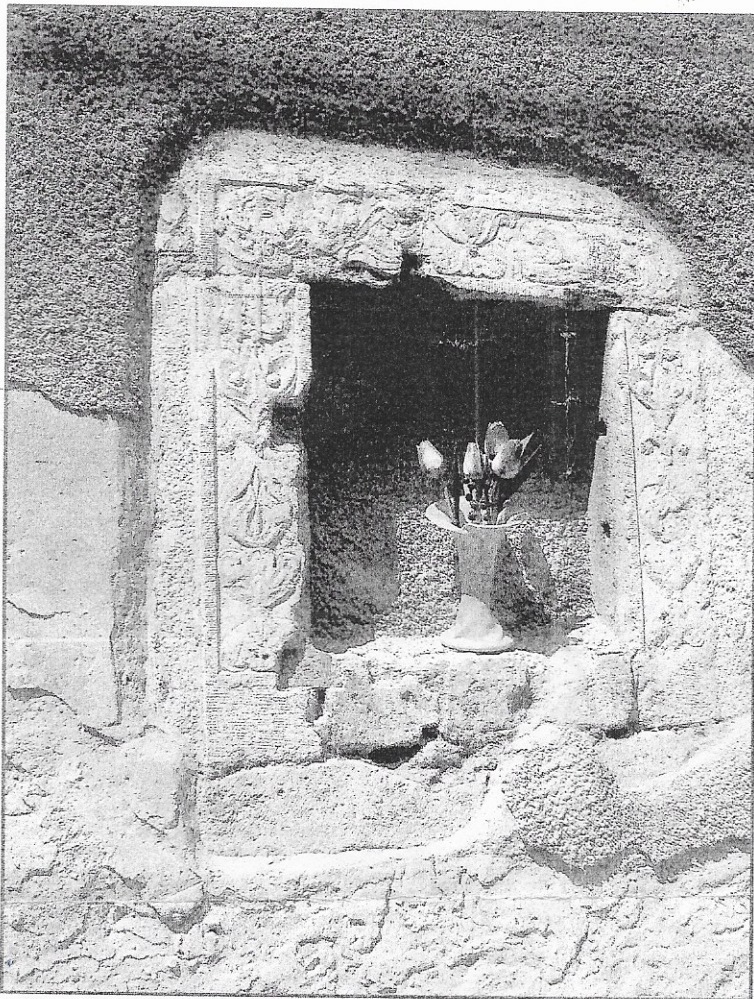
Az épület falán ma is látható a kiemelkedő értékű, kis reneszánsz virágmintás ablakkökeret